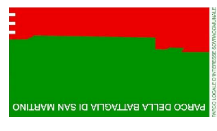
TAVOLA 08 IPOTESI DI PROGETTO - PERCORSI CICLOPEDONALI SCALA 1:10000 APRILE 2016