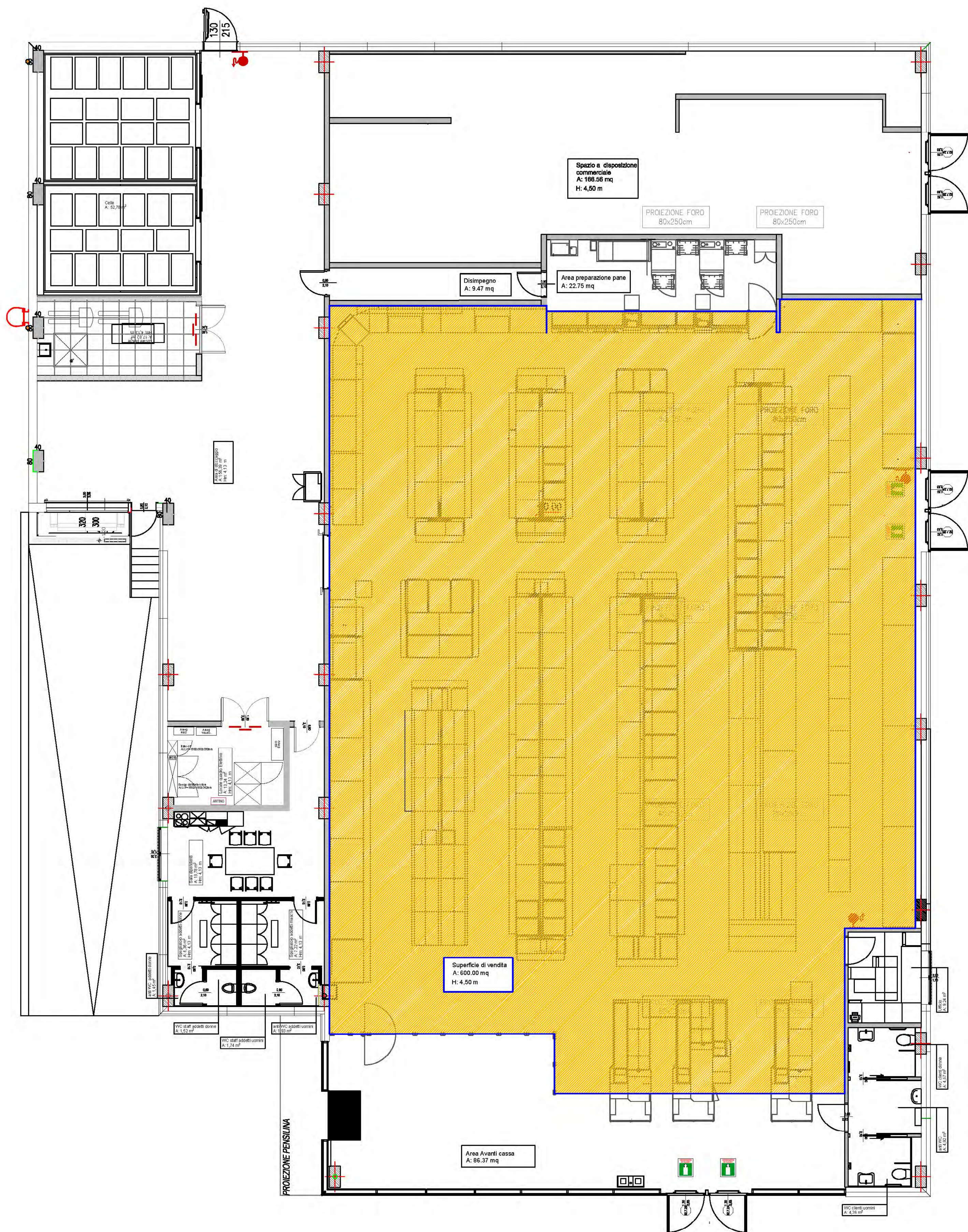
Pianta Piano terra - Stato di fatto Dimostrazione Superficie di Vendita

SUPERFICIE VENDITA AREA 600,00 m 2 DI CUI - 450 m 2 ALIMENTARI - 150 m 2 NON ALIMENTARI