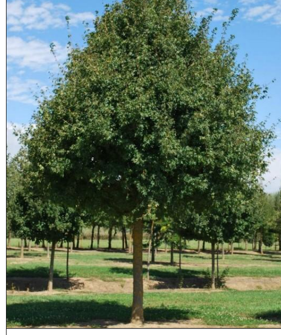
ACERO CAMPESTRE - n. 3-4-5-6-7-8-9-10-11