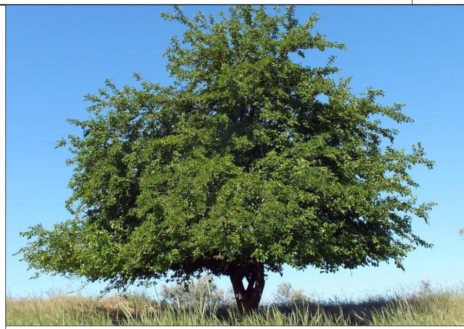
GELSO - n. 2