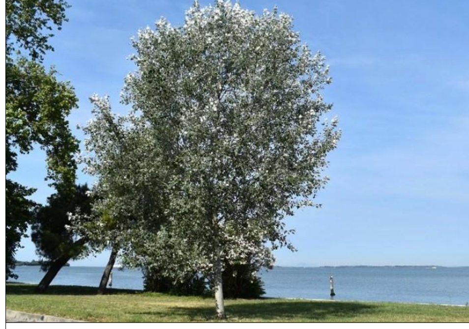
PIOPPO BIANCO - n. 12