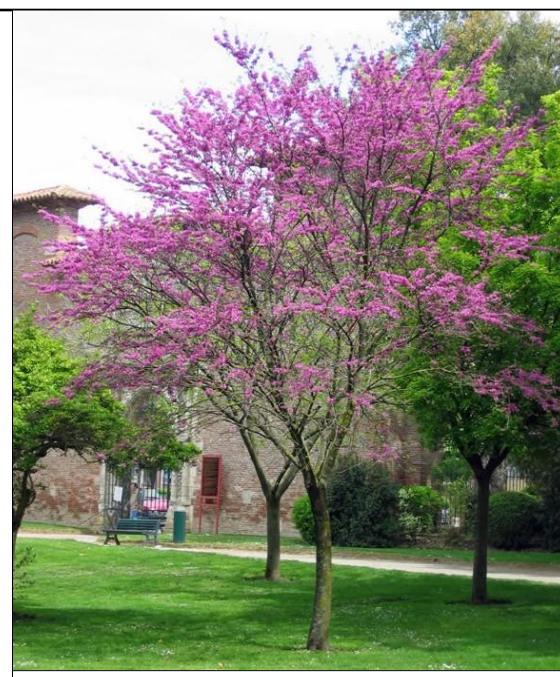
ALBERO DI GIUDA - n. 1